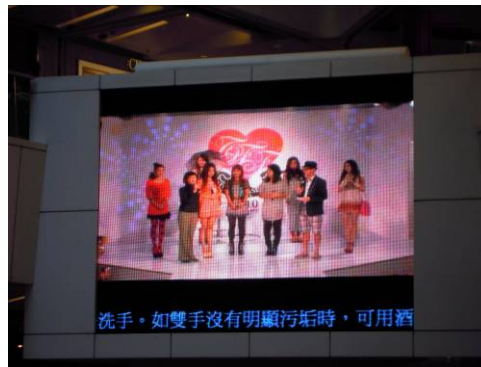
(左上:館内看板、右上:会場周辺でのビラ配布、 左下:PR イベント後、館内のメイン会場にある大画面にてショーの様子と売場の紹介を放映)