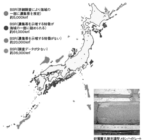
図表7 日本周辺での分布図

※BSR：海底擬似反射面と呼ばれる反射面により地層中のメタンハイドレートを推定