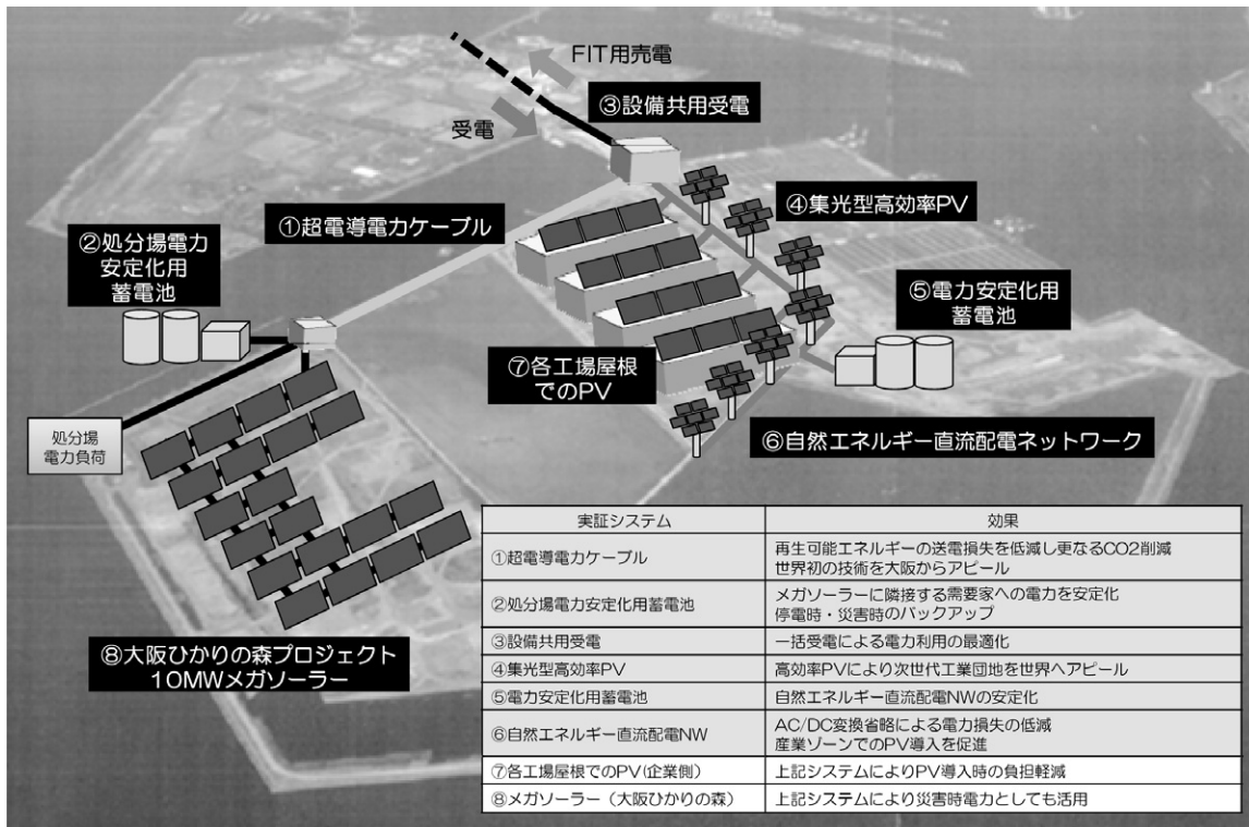
図表11 夢洲地区における電力インフラのシステム構築構想

特に、通常時には一般電気事業者に売電している再生可能エネルギーを、非常時には即座に地域内に融通できるようなインフラ整備が必要であり、法体系を見直しつつ全国的にこのような整備が求められる。