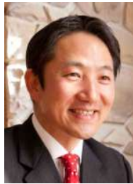
本川祐治郎氏 (氷見市長)

金沢大学工学部卒業。相良町議会議員、静岡県議会議員を経て、2005年10月に初代牧之原市長に就任。「市民が主役」の理念に基づき、市民参加のワークショップによる「男女協働サロン」を推進。市民が「学び」「気づき」「共感し」「支援しあう」まちづくりに取り組む。「津波防災まちづくり」で第8回マニフェスト大賞(市民部門)グランプリ受賞。現在3期目。