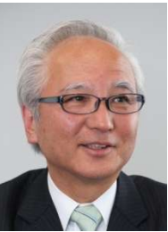
西原茂樹氏 (牧之原市長)

金沢大学工学部卒業。相良町議会議員、静岡県議会議員を経て、2005年10月に初代牧之原市長に就任。「市民が主役」の理念に基づき、市民参加のワークショップによる「男女協働サロン」を推進。市民が「学び」「気づき」「共感し」「支援しあう」まちづくりに取り組む。「津波防災まちづくり」で第8回マニフェスト大賞(市民部門)グランプリ受賞。現在3期目。