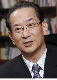
北川正恭氏 (早稲田大学大学院教授)

1944年生まれ。1967年早稲田大学第一商学部卒業。1972年三重県議会議員当選(3期連続)、1983年衆議院議員当選(4期連続)。1995年、三重県知事当選(2期連続)。「生活者起点」を掲げ、ゼロベースで事業を評価し、改革を進める「事業評価システム」や情報公開を積極的に進め、地方分権の旗手として活動。達成目標、手段、財源を住民に約束する「マニフェスト」を提言。2期務め、2003年4月に退任。現在、早稲田大学政治経済学術院大学院政治学専攻公共経営専攻(公共経営大学院)教授、「新しい日本をつくる国民会議」(21世紀臨調)代表。平成21年地域主権戦略会議構成員