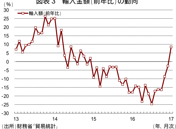
図表3 輸入金額(前年比)の動向