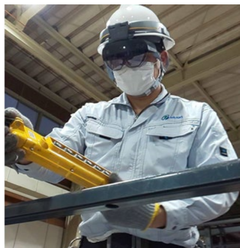
(株)アラキ製作所、イクスアール(株)